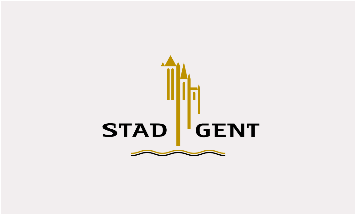
vandekerckhove&devos en raymond jacquemyns logo van de stad gent 1997