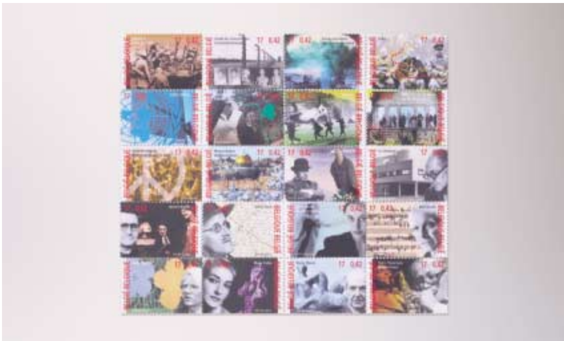
rob buytaert "oorlog en vrede" en "kunst", 2 reeksen van 10 zegels voor de post 2000